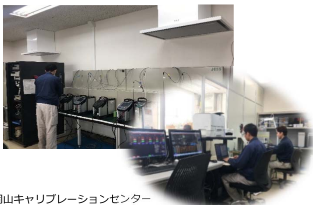
岡山キャリブレーションセンター

当社は、ILAC-MRA対応のJCSS登録事業者です。 JCSS0300は、当社校正室(岡山キャリブレーションセンター)の登録認定番号です。